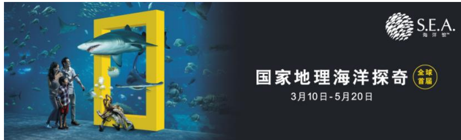
首届“国家地理海洋探奇”主题活动

除了奢华酒店，圣淘沙名胜世界还有缤纷多彩的度假体验等着会玩的你：新加坡环球影城、S. E. A. 海洋馆、水上探险乐园、海豚园以及全新升级的海事博物馆，都将在春季陆续推出别出心裁的活动，让你不用舟车辗转，越玩越畅快！在这些活动当中， S. E. A. 海洋馆 全球首届“ 国家地理海洋探奇 ”主题活动颇受期待，3月10日到5月20日期间，快来参观“海洋之最”精彩展览，参与海洋摄影之旅，以及主打新加坡首个海洋科学及航海探索的国家地理海洋探索儿童工作坊，并与海洋馆的新成员沙虎鲨见面！