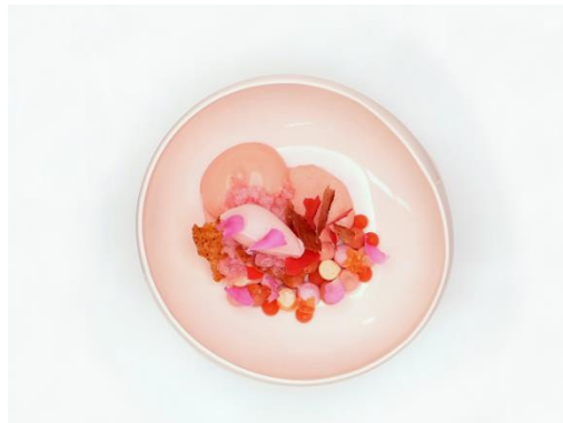
第十届 CURATE 美食艺术品鉴会特邀主厨(图左)与招牌菜(图右)