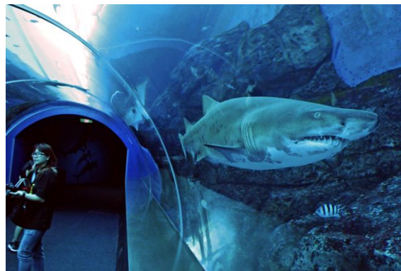
S. E. A. 海洋馆新物种虎鲨