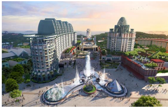
圣淘沙名胜世界全景图

春寒料峭的时节拥抱热带海岛的艳阳，在熟悉的环境中感受异域文化带来的惊喜。既摩登又风情的新加坡是个不错的选择。目前，中国众多城市和地区均已开通到新加坡的直航，为小长假“延长”规划除去了第一道障碍。而在全狮城，圣淘沙名胜世界更是资深玩家们延长假期的私藏圣地。